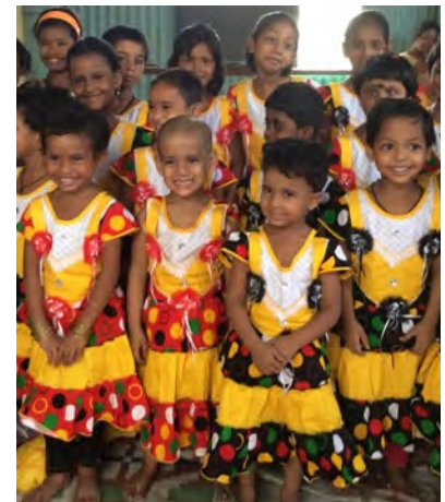
VÊTEMENTS DE FÊTES

Merci à vous de soutenir le programme de votre choix :